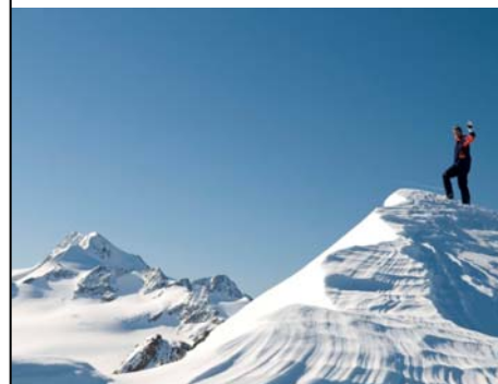
SPORTREISEN-SPEZIAL: Alle Reisen des Winters 2009/2010